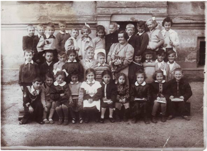
Artykuł z lokalnej gazety, napisany przez nauczyciela o maturzystach z 1967 roku.